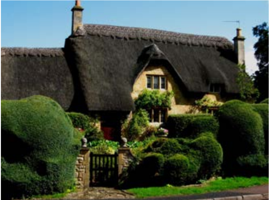
Cottage in Chipping Campden

Die Cotswolds, eine Gegend südlich von Stratford-upon-Avon und nordwestlich von Oxford, zählen für mich zu den romantischsten Ecken der Insel. In diesem Bilderbuch-England finden Sie malerische Dörfer aus gelbem Sandstein, eingebettet in idyllische, leicht hügelige Landschaft und zahlreiche Gärten, die eindrucksvoll zeigen, worauf es bei der Planung wirklich ankommt.