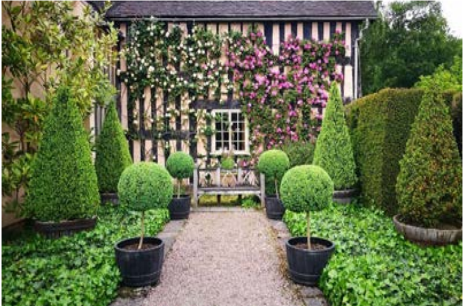
Wollerton Old Hall

Erstmals werde ich mit einer Gruppe von Gartenliebhabern diese Ecke Englands erkunden. Die beiden Grafschaften nordwestlich von Birmingham sind bei uns weitgehend unbekannt, bieten aber eine Fülle an sehr interessanten Gärten und pittoresken Ortschaften. Mein Ordner mit gesammelten Gartenreportagen dieser Gegend ist voll & meine Neugierde werde ich nun endlich stillen.