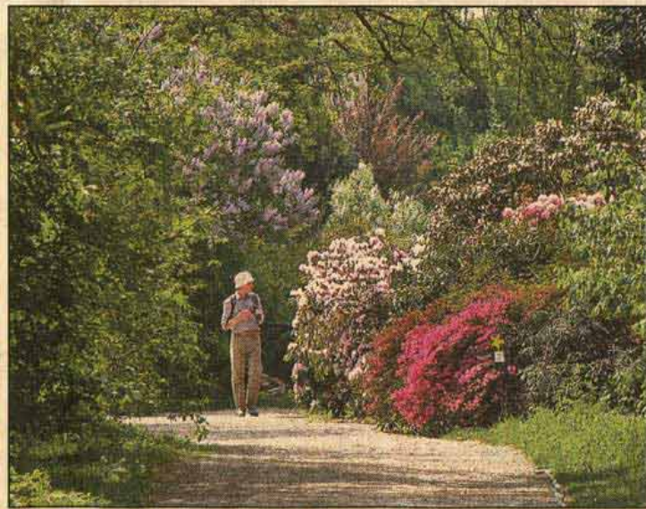
Der Botanische Garten der Universität Wien (HBV) braucht den Vergleich mit berühmten Schaugärten im Ausland nicht zu scheuen.